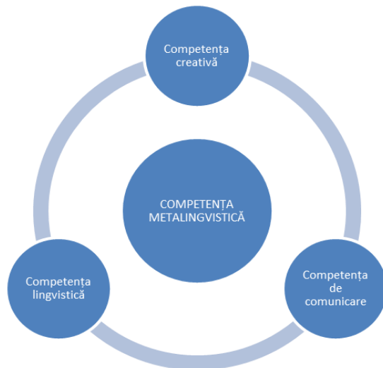
Figura I. Competența metalingvistică

Definim conceptele utilizate după cum urmează: